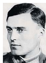
Graf von Stauffenberg

nehmigung für den Bendlerblock geben, in dem der deutsche Widerstandskämpfer Graf von Stauffenberg sein Attentat auf Hitler am 20. Juli 1944 verüben wollte und ermordet wurde. Cruise will die Rolle des Stauffenberg spielen, was für heftige Diskussionen sorgt. dpa